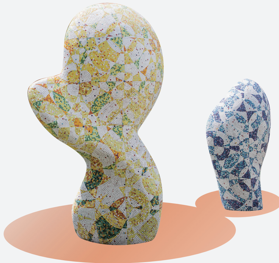
「綠色奇蹟 - 奇蹟」 / 國農大樓