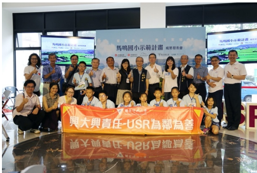
興大、永豐銀、看見·齊柏林基金會推動《看見家鄉》