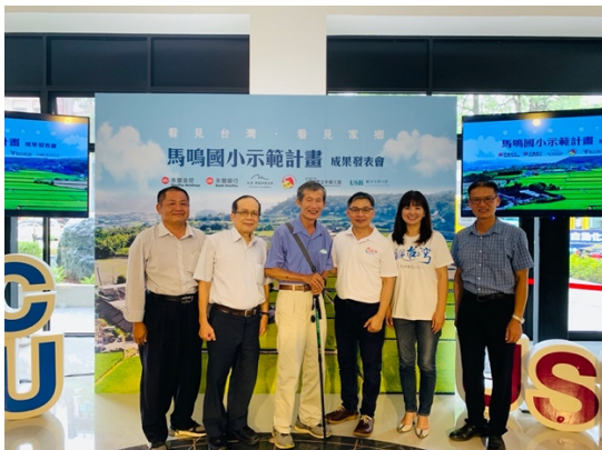
興大、永豐銀、看見·齊柏林基金會推動《看見家鄉》