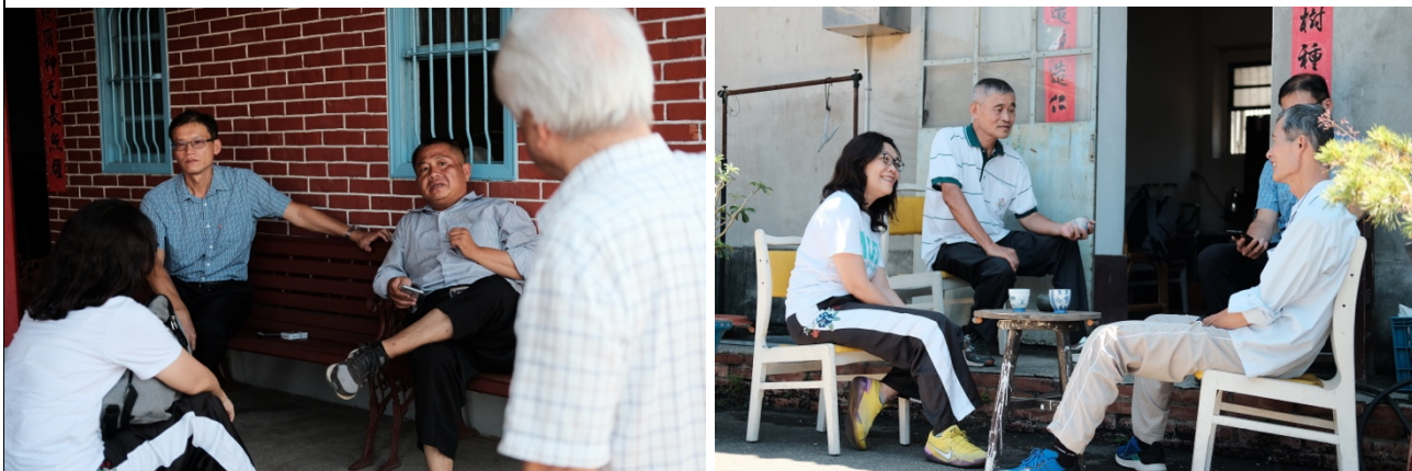
[附件六] 第一次工作會議會議記錄